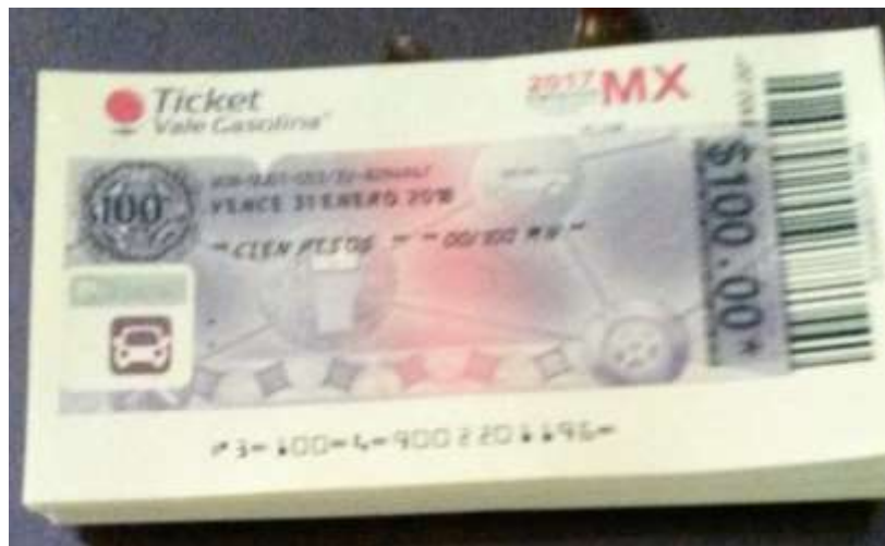
VALES DE GASOLINA