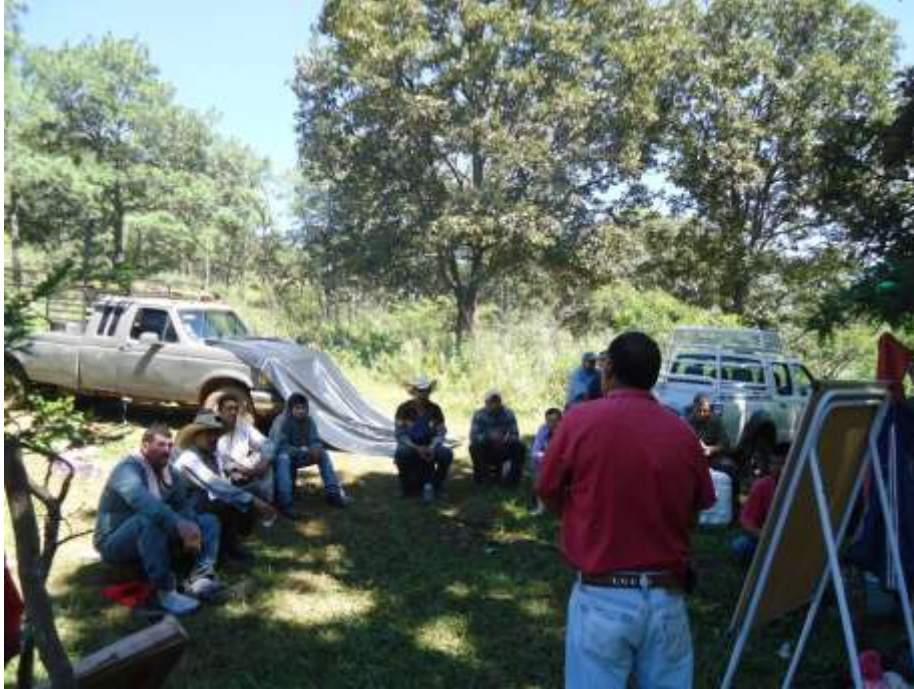
CAPACITACIÓN UMAFOR 1404/SIERRA DEL TIGRE, DEL HALO Y LOS VOLCANES