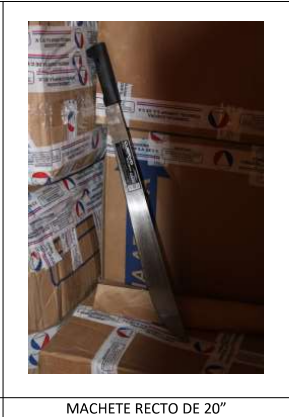
MACHETE RECTO DE 20"