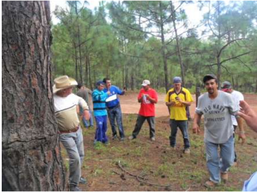
CAPACITACIÓN UMAFOR 1406 / AUTLAN