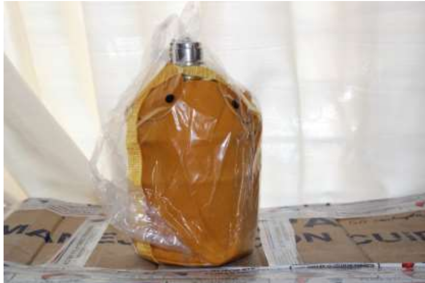
CANTIMPLORA DE ALUMINIO 2LTS