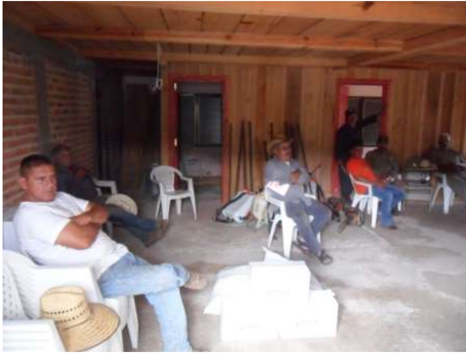
CAPACITACIÓN UMAFOR 1402 / ALTOS DE JALISCO