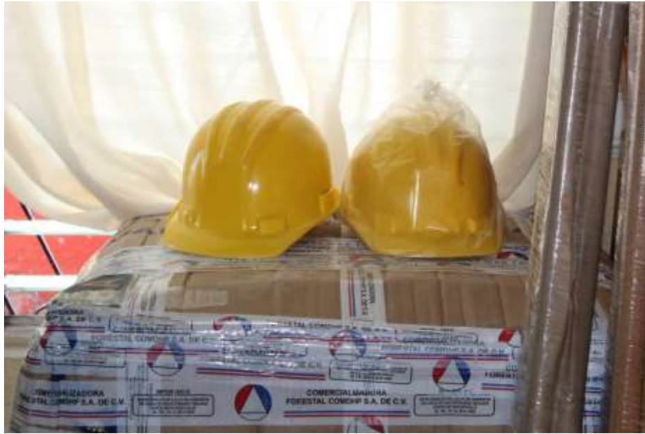
CASCO PROTECTOR AMARILLO