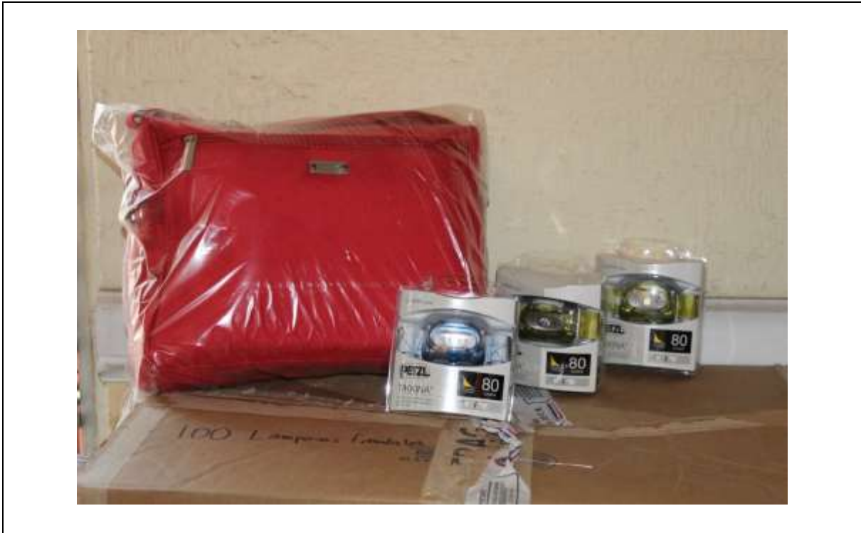
BOTIQUÍN Y LAMPARA FRONTAL