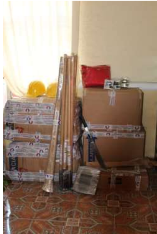
RASTRILLO AZADÓN MCLEOD CUMPLE FSS