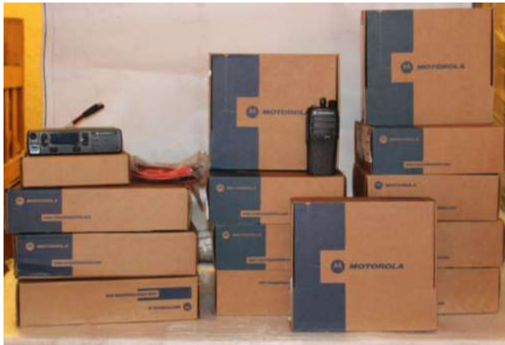
RADIO PORTATÍL Y RADIO MÓVIL