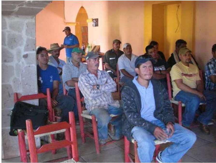
CAPACITACIÓN UMAFOR 1411 / COSTA DE JALISCO