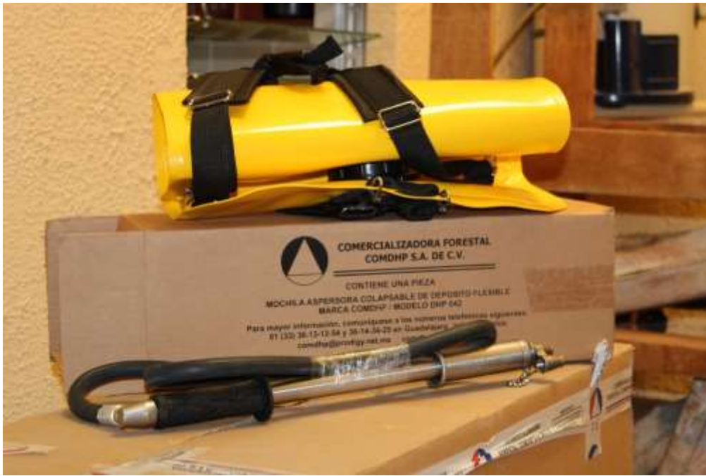
MOCHILA ASPERSORA COLAPSABLE