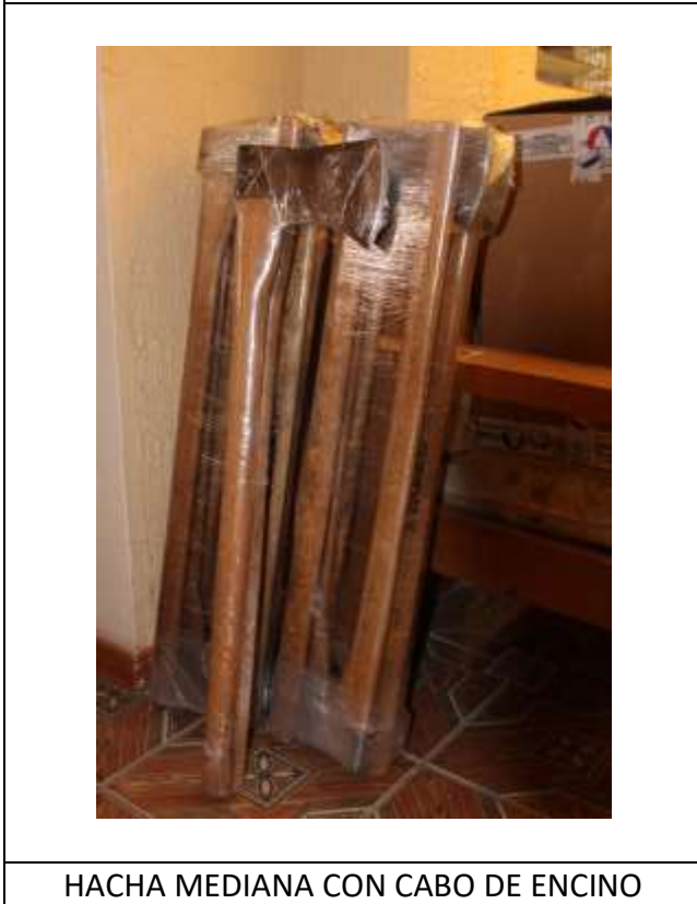
HACHA MEDIANA CON CABO DE ENCINO