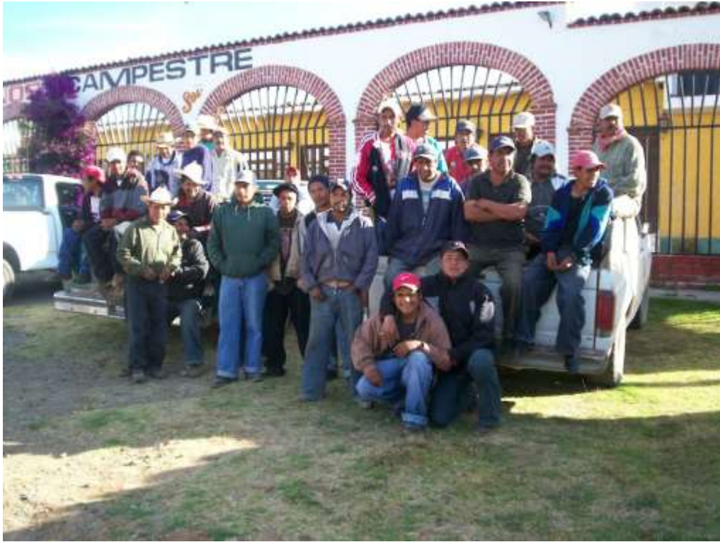
CAPACITACIÓN UMAFOR 1405/TAPALPA