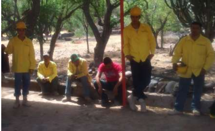
CAPACITACIÓN UMAFOR 1401 / NORTE DE JALISCO