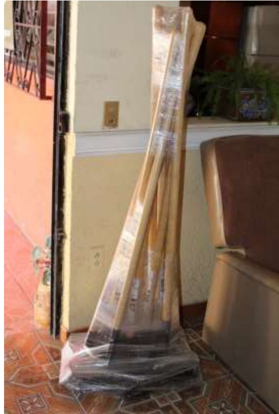
RASTRILLO FORESTAL CON AZADÓN