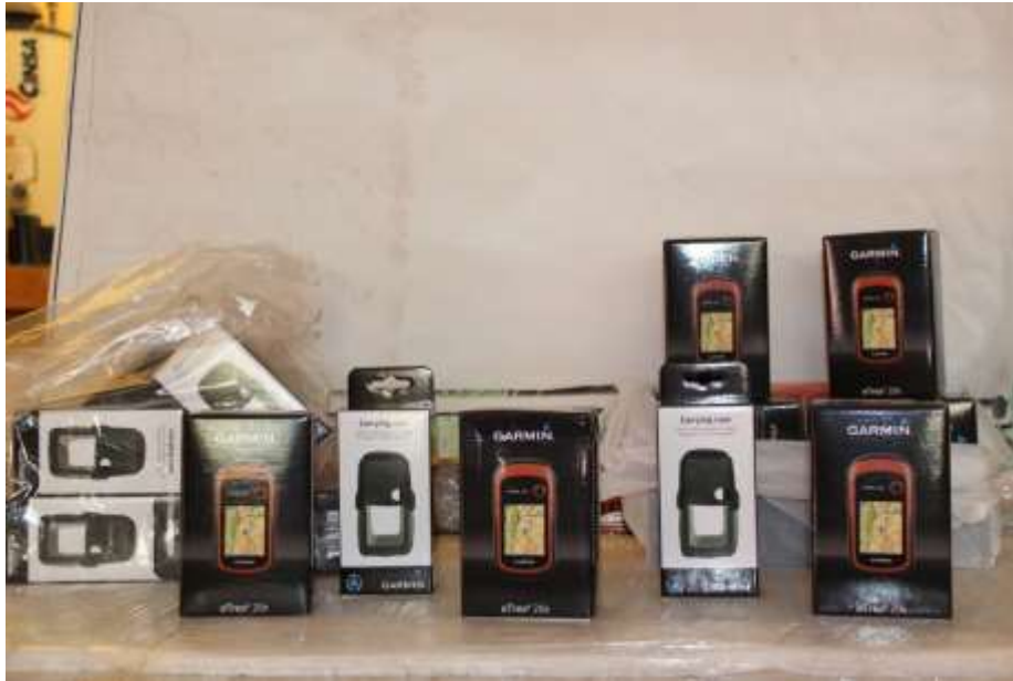
GPS GARMIN ETREX-20