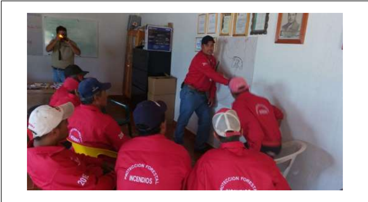
CAPACITACIÓN UMAFOR 1409/ MASCOTA